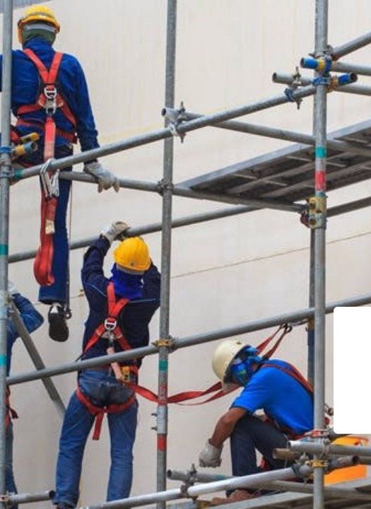
MONTAGEM DE ANDAIMES- NR 18