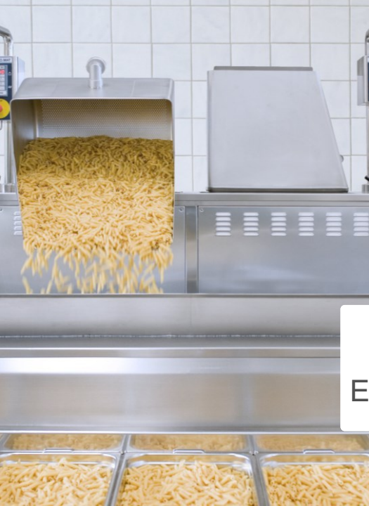
MÁQUINAS E EQUIPAMENTOS – NR 12