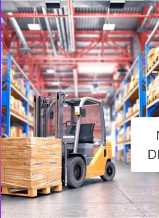
MOVIMENTAÇÃO DE CARGAS – NR 11