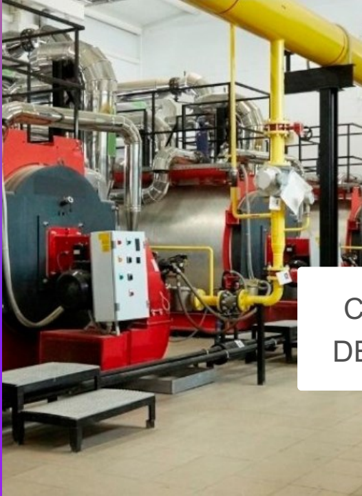
CALDEIRA E VASOS DE PRESSÃO- NR 13