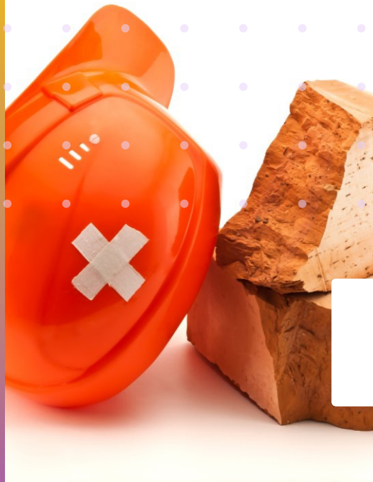
FORMAÇÃO CIPA – NR 05 NR 23