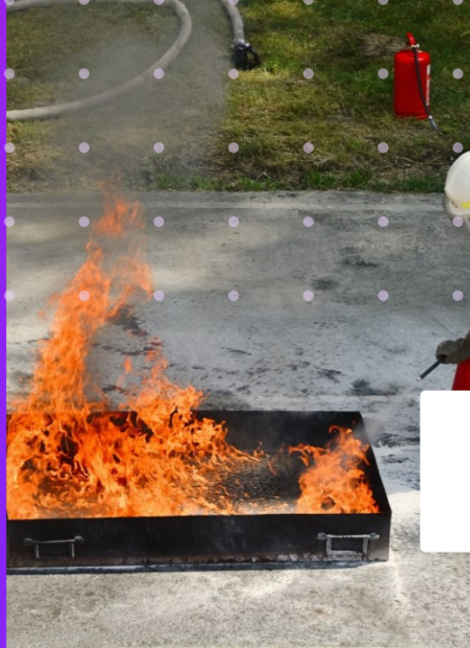
BRIGADA CONTRA INCÊNDIO – NR 23